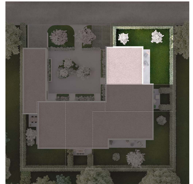
VILLA E Étage