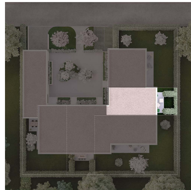
VILLA D Étage