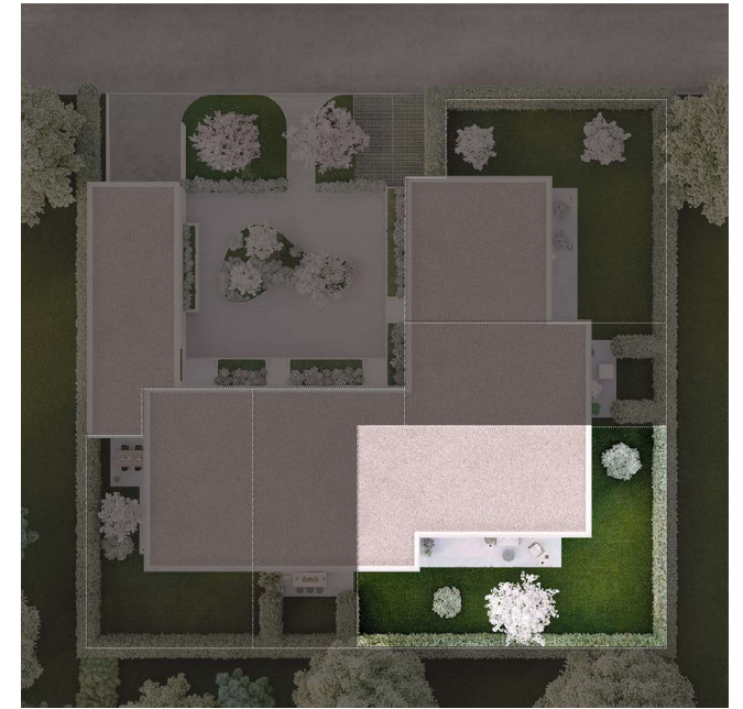
VILLA C Étage