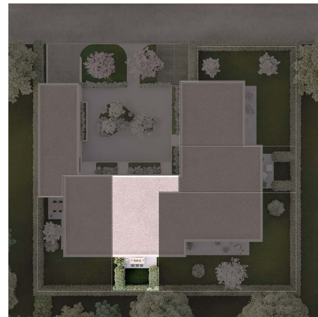
VILLA B Étage