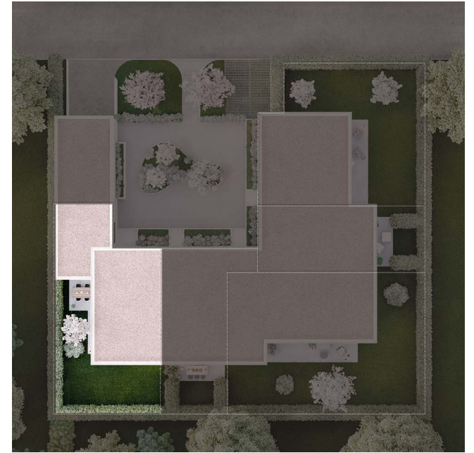
VILLA A Étage