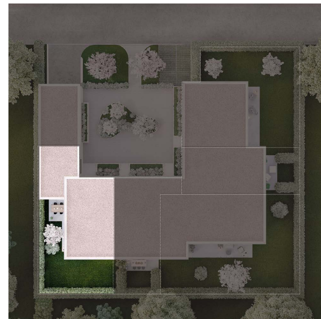
VILLA A Sous-sol