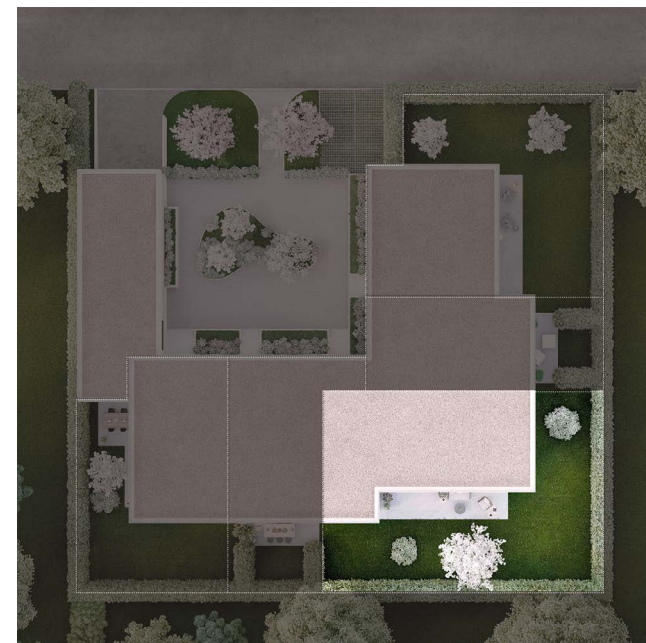
VILLA C Sous-sol